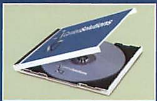
DVD DE INSTRUCCIONES

Soporte de cara hacia abajo robusto y seguro para las horas de dormir y las horas de estar despierto