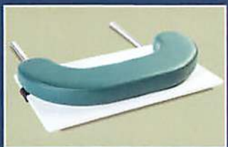
APOYA BRAZOS PARA MAYOR COMODIDAD