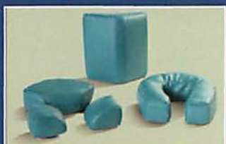
COJINES INTERCAMBIABLES DE ESPUMA DE MEMORIA