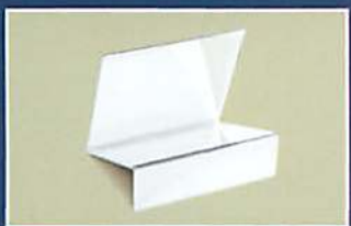
ESPEJO INVERSO ESPECIAL