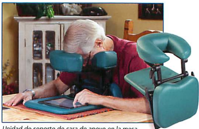
Unidad de soporte de cara de apoyo en la mesa

Nuestro sistema de soporte de cara ofrece dos opciones que proveen suficiente espacio para respirar con ajuste personalizado. Las dos opciones proveen confort y apoyo y al dormir usted se dará cuenta de algún movimiento accidental que la permitirá corregirlo inmediatamente.