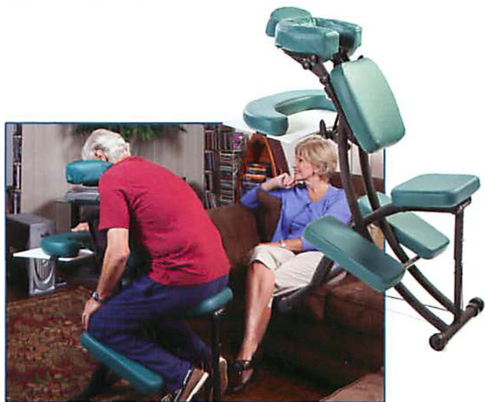
Unidad completa de silla ergonómica

Nuestro sistema de soporte de cara ofrece dos opciones que proveen suficiente espacio para respirar con ajuste personalizado. Las dos opciones proveen confort y apoyo y al dormir usted se dará cuenta de algún movimiento accidental que la permitirá corregirlo inmediatamente.